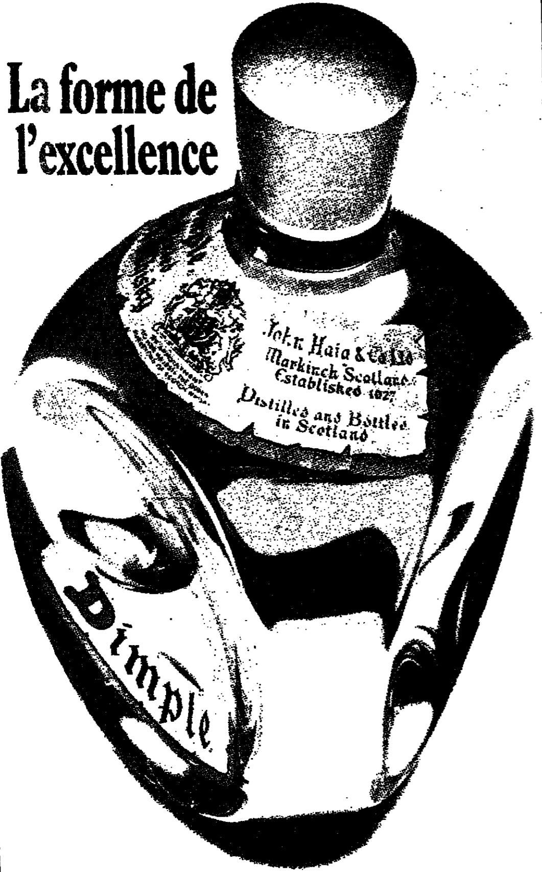
SUPERIOR DE LUXE SCOTCH WHISKY John Haig & Co. Ltd. MARKINCH SCOTLAND